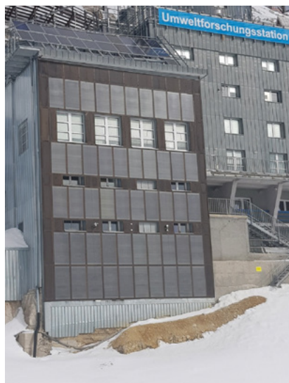
Vakuumflächenkollektoren an der Zugspitze-Umweltforschungsstation

Auf der Basis der oben beschriebenen außerordentlich positiven Leistungsmerkmale ist die leider in Vergessenheit geratene Solarthermie neu zu bewerten . Die hier abgebildete Umweltforschungsstation auf der Zugspitze betreibt Vakuumflächenkollektoren als Fassadenverkleidung seit über 30 Jahren unter extremen Bedingungen.